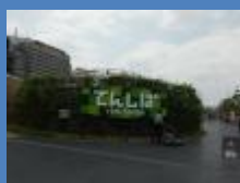
てんしば天王寺ゲート エントランス

地下鉄御堂筋線・谷町線 天王寺駅 JR 天王寺駅 近鉄 大阪阿部野橋駅 阪堺上町線 天王寺駅前駅 各駅から徒歩すぐ